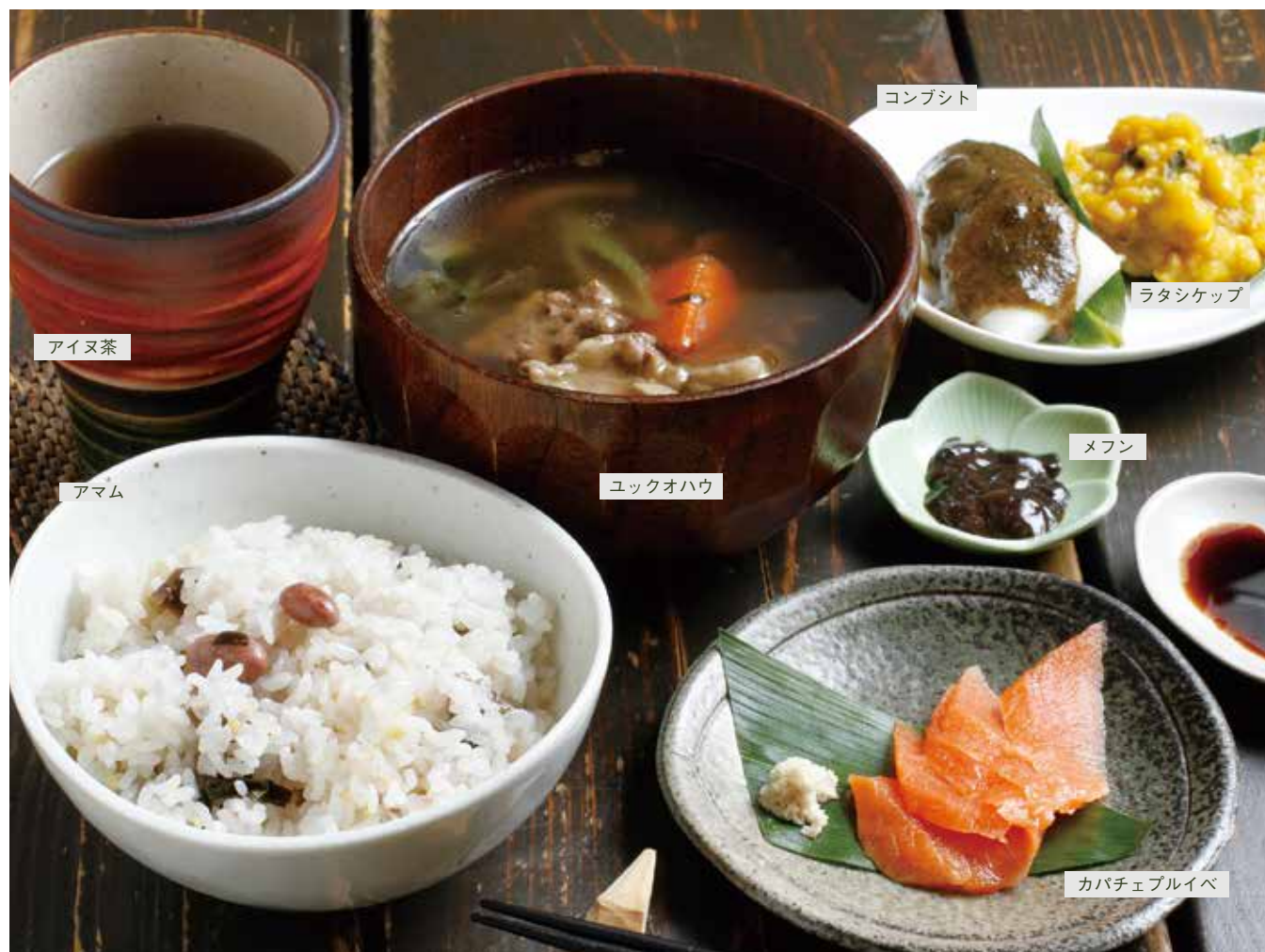
※季節により、メニュー内容が変更となります。